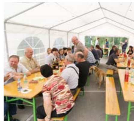
Zbrana družčina proslavlja