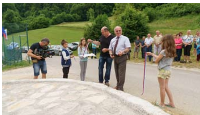
Slavnostno rezanje traku